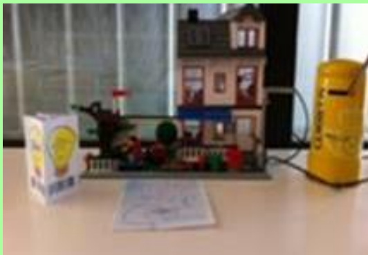
*Premiat en el CIC 2012

El projecte sorgeix del voler promoure l'enginy de progrés que els homes sempre hem mostrat i pretén que, utilitzant la vostra imaginació, penseu en com millorar el planeta creant i descobrint tot allò desconegut, simplement perquè us piqui la curiositat.